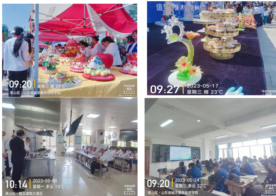
图为学院师生良好精神风貌缩影

为建设良好教风与学风，进一步加强教学管理、规范校园秩序和课堂教学秩序，确保学院各项工作高标准、高质量、高效率开展，质控办对各院系教学情况进行了全面督导和检查。督导检查发现，各院系比较重视教学管理工作，教学秩序总体情况较好，教学设施设备基本运转正常，教室、实训室卫生及物品摆放规范。